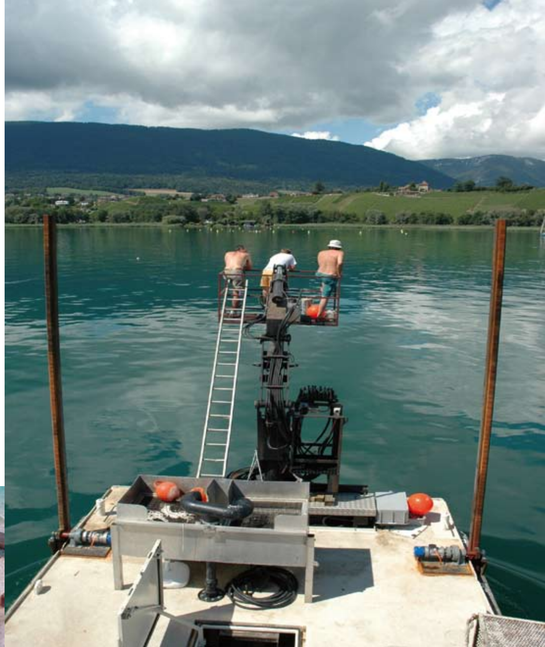
Plate-forme pour la recherche