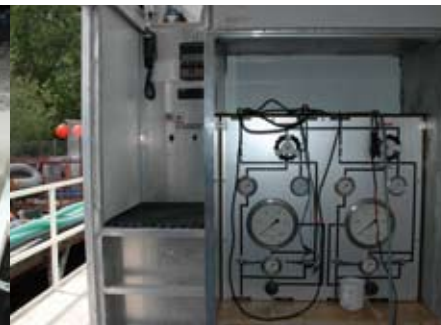
Bateau équipé de deux narguilés de 50 m et tableau de contrôle avec communication