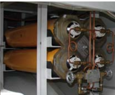
Bloc tampon de 200 litres à 220 bars