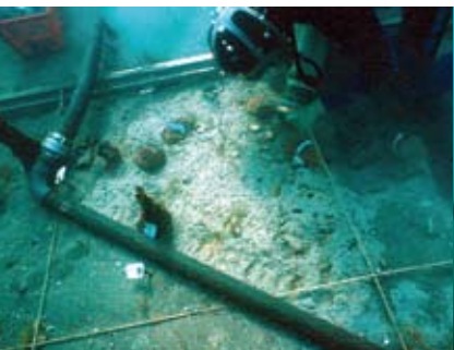
Tuyère pour courant d'eau