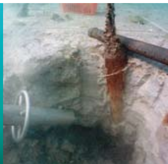
Suceuse d'un diamètre de 90 cm