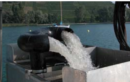
Station de tamisage