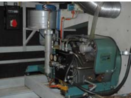
Compresseur air 220 bars pour plongée