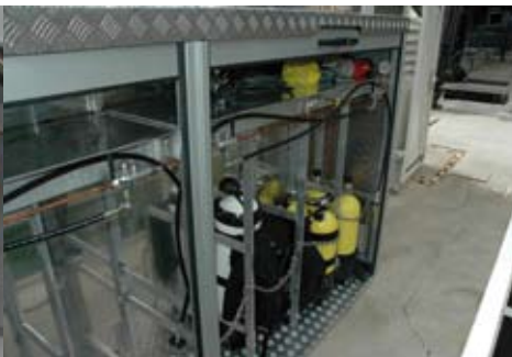
Armoire de gonflage